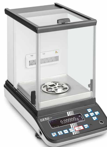
2 KERN ABP 100-5DM con ionizador opcional

Balanza analítica Premium con el sistema Single-Cell de última generación para unos resultados de pesaje extremadamente rápidos y estables, ahora también en versión con puertas corredizas automáticas